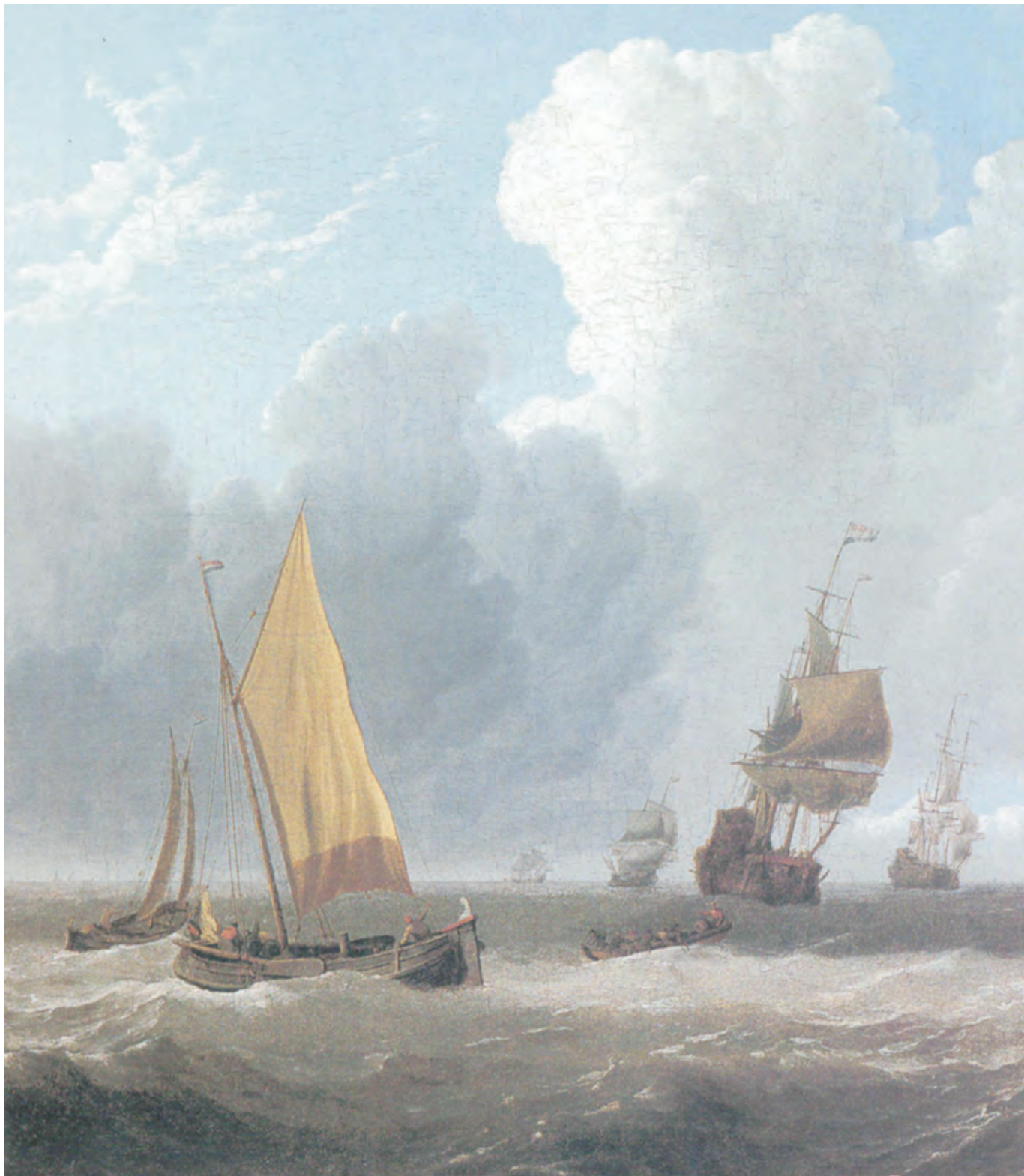
WILLHEM VAN DE WELDE, the younger: «Ολανδικά πλοία ακτοπλοΐας» (λάδι σε μουσαμά)

λιθική ενότητα απόψεων που επιβάλλουν οι ιδρυτές του ή, πάλι, τον σιωπηρό όρκο πίστης τον οποίον δίνουν οι κινηματικοί συντηρητικοί.